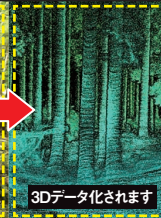
3Dデータ化されます